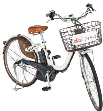
電動アシスト自転車

OpenStreet とシナネンモビリティ PLUS と三芳町は今後も、安全にご利用いただけるマルチモビリティのシェアリングサービスの提供を通じて、移動の利便性向上や暮らしやすいまちづくりの促進を目指します。