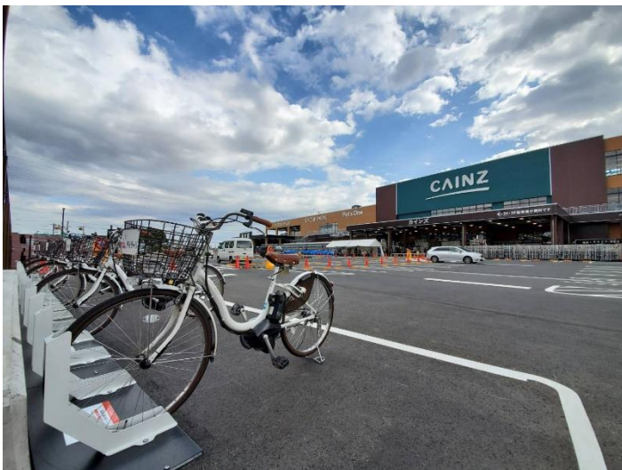
「くみまちモールあさか」(埼玉県朝霞市根岸台3丁目20番1号)