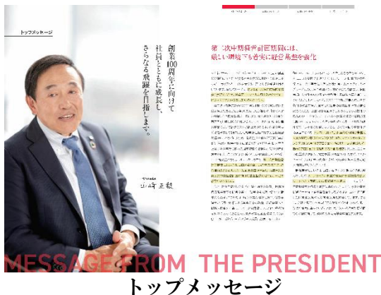
トップメッセージ