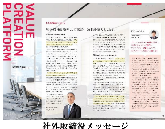
社外取締役メッセージ