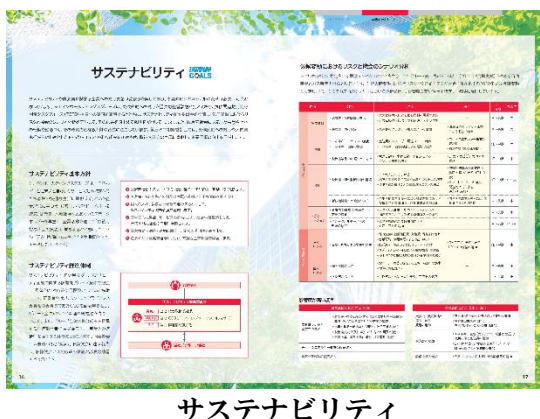
サステナビリティ