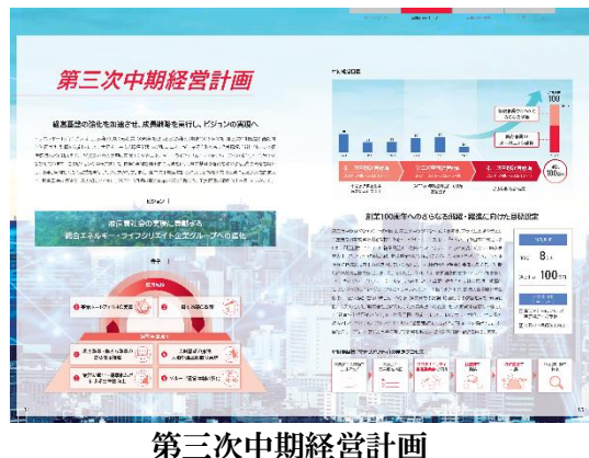
第三次中期経営計画