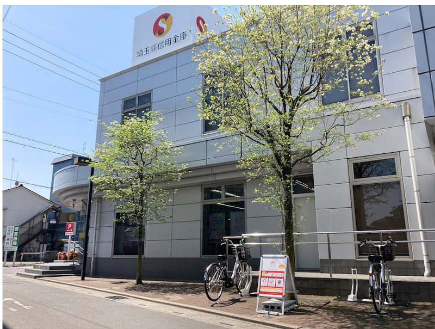
埼玉縣信用金庫 北草加支店（住所：埼玉県草加市八幡町 757 番 1 号）