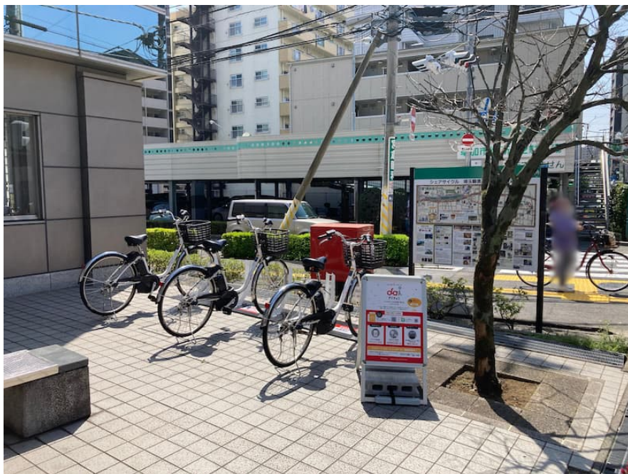
埼玉縣信用金庫 草加支店（住所：埼玉県草加市高砂 1 丁目 7 番 1 号）