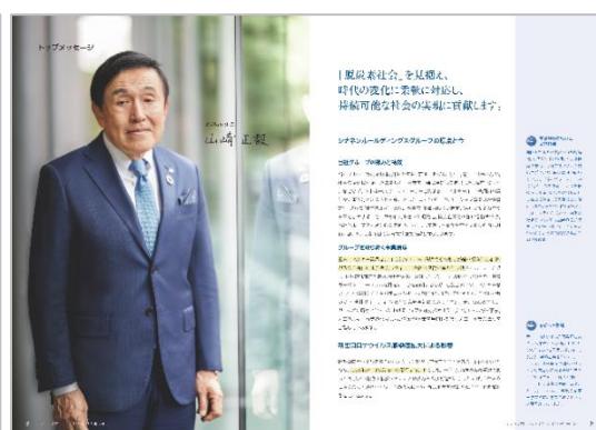
トップメッセージ