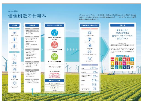
価値創造の仕組み