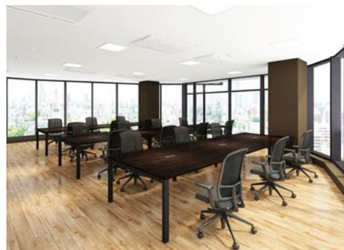
10F：シェアオフィス（イメージ）