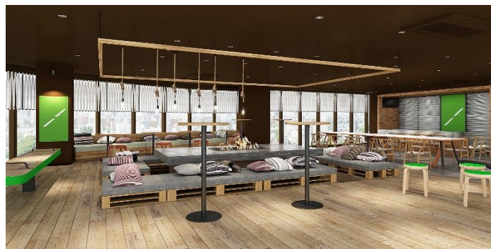
9F：コワーキングスペース（イメージ）

シェアオフィスのフロアは、シェアオフィス・コワーキングスペース・イベントスペースの3つの機能を持つ施設にいたしました。8階が「過去」をイメージしたフロアで、内省を促したり、集中力を高めるためのスペースを用意しています。9階は、8階と10階を繋げ、外との結節点でもある「現在」をイメージした施設の象徴的なフロアで、入居者用のイベントスペースも設けています。10階は「未来」をイメージしたフロアで、新しい挑戦への打ち合わせや会議のためのミーティングスペースを用意しています。